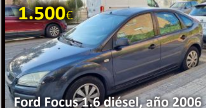
Ford Focus 1.6 diésel, año 2006