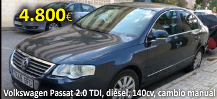
Volkswagen Passat 2.0 TDI, diésel, 140cv, cambio manual