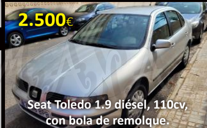
Seat Toledo 1.9 diésel, 110cv, con bola de remolque.