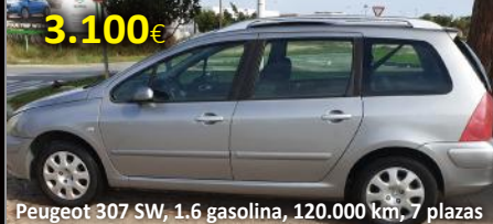
Peugeot 307 SW, 1.6 gasolina, 120.000 km, 7 plazas